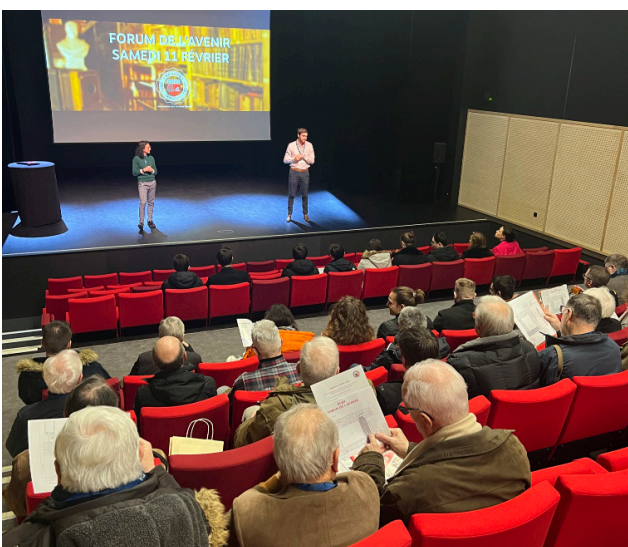
Briefing de bienvenue