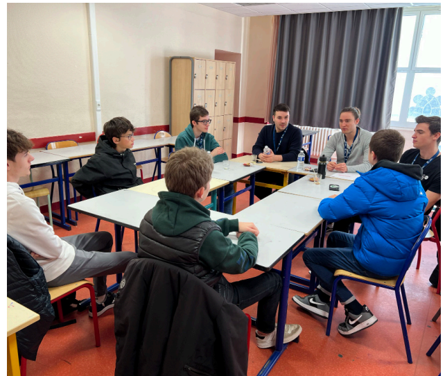
Domaine "développement web"