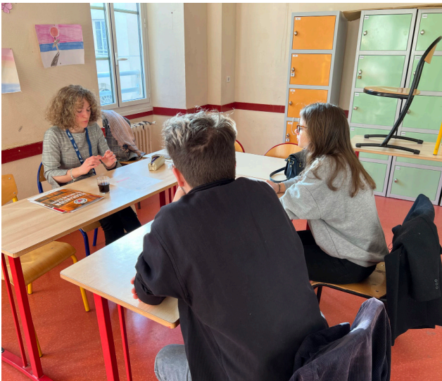
Domaine "ressources humaines"

Nous vous donnons rendez-vous en 2024 pour la prochaine édition !