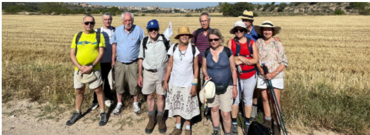
Sur le chemin ignatien

Juste avant le congrès, la fédération française des anciens élèves des jésuites avait organisé une marche-réflexion de trois jours sur le chemin dit ignatien, celui suivi par Ignace de Loyola après sa conversion. Une quinzaine d'anciens de différents collèges français ont pris part à cette marche à raison d'une vingtaine de km par jour dans la belle campagne de l'arrière-pays de Barcelone. Partis de Verdù, village natal de Pierre Claver jésuite défenseur des esclaves noirs d'Amérique espagnole au XVI ème siècle, nous avons marché jusqu'à Montserrat, monastère bénédictin haut-lieu de la culture catalane depuis des siècles.