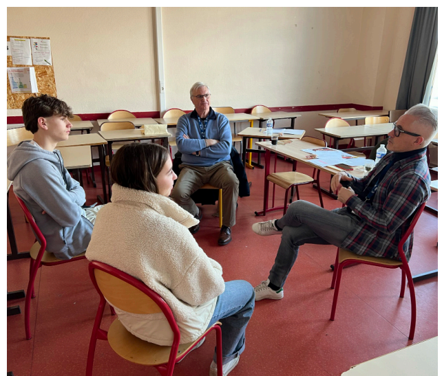
Domaine "tourisme et hôtellerie"