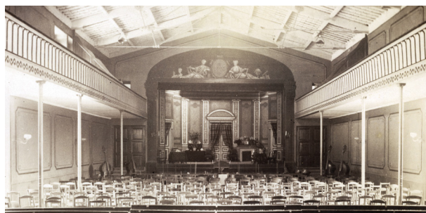
Vue intérieure du théâtre en 1891.

Grande salle, salle des séances, salle des exercices, salle des fêtes ou théâtre, le public vannetais vient volontiers y applaudir les discours et les vers latins, les dissertations et poésies françaises, les essais dramatiques. Les académies des classes de Philo, Rhétorique et Humanités, présentent chacune leurs travaux en des séances solennelles. Ces soirées littéraires sont ordinairement entremêlées de musique interprétées par l'orchestre du Collège. Le programme, imprimé et distribué à l'avance, constitue en quelque sorte le résumé des travaux les plus remarquables du trimestre ou du mois écoulé. Des personnages historiques édifiants pour la jeunesse servent de thème aux développements les plus variés. Citons Gilles de Bretagne , drame latin par l'académie de Rhétorique (1861), Duguesclin à Montiel , drame historique en vers français mais aussi Alfred Le Grand , François-Xavier et Jeanne d'Arc , oratorio en cinq actes donné en 1905 et 1910.