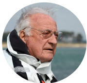
FRANÇOIS-RÉGIS HUTIN (1929-2017)