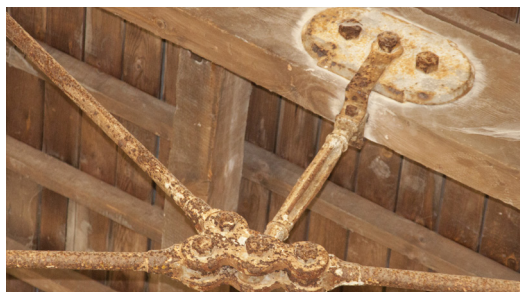
Détail de la charpente Polonceau, 2011.